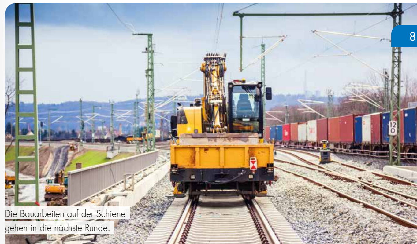
Die Bauarbeiten auf der Schiene gehen in die nächste Runde.

Einfacher wird ab April die verbundübergreifende Fahrradmitnahme, denn die bislang nur in den Zügen gültige Fahrradtagskarte Nahverkehr des Deutschlandtarifs für 6,50 Euro wird ab sofort auch in den Regionalbussen, Straßenbahnen und fast allen Fähren im VVO, VMS und ZVON anerkannt.