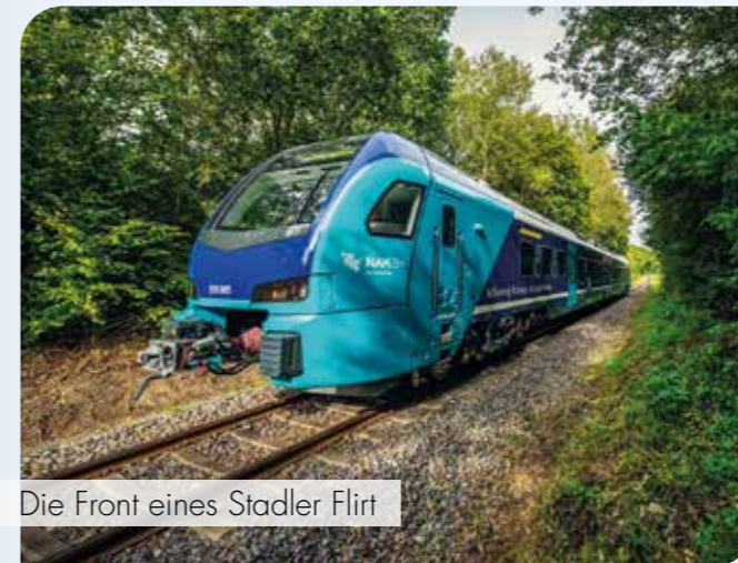
Die Front eines Stadler Flirt