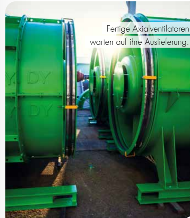
Fertige Axialventilatoren warten auf ihre Auslieferung.