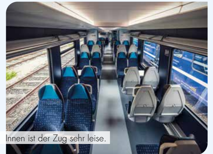
Innen ist der Zug sehr leise.

Schleswig-Holstein und die lokale Nahverkehrsgesellschaft NAH.SH gehen derzeit einen großen Schritt Richtung Verkehrswende: Vor viereinhalb Jahren hat das Land nach umfangreichen Vorgesprächen mit Fahrzeugherstellern die Vergabeverfahren zum Projekt „Akku statt Diesel“ gestartet. Dabei ging es nicht nur um neue Antriebsformen, sondern auch um mehr Wettbewerb unter den Bahngesellschaften und Herstellern von Zügen.