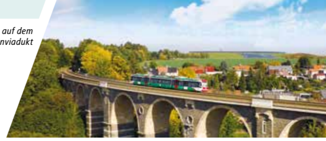
Citylink auf dem Bahrebachmühlenviadukt