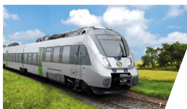
1-3 S-Bahn im Mitteldeutschen S-Bahn-Netz (MDSB)