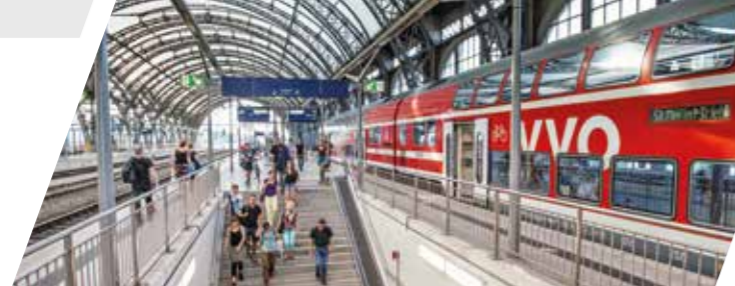
S-Bahn im Dresdner Hauptbahnhof

Weitere Informationen erhalten Sie bei den Verkehrsunternehmen und -verbänden.