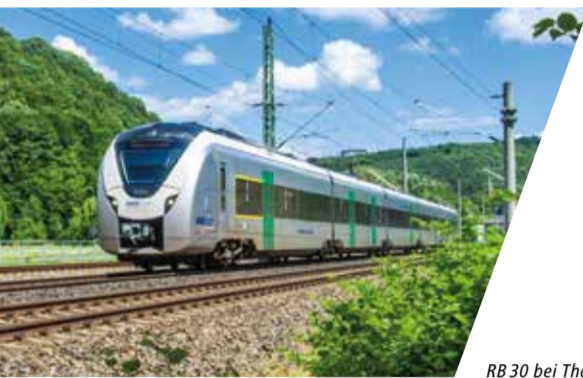
RB 30 bei Tharandt

Wir möchten Ihnen die Nutzung des öffentlichen Verkehrs so einfach wie möglich gestalten und verbessern die Anschlüsse zwischen Bus und Bahn, sorgen für ein einheitliches Tarifsystem, verständliche Informationen und kundenfreundlichen Service.