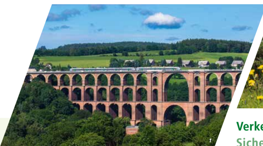
1 Göltzschthalbrücke 2-3 Regio shuttle der vogtlandbahn